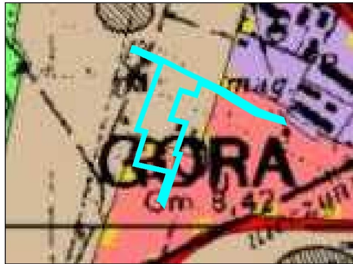
Granica obszaru objętego planem